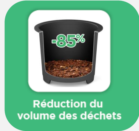
Réduction du volume des déchets