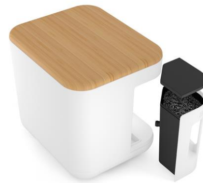
Filtre anti-odeurs au charbon actif, rechargeable.