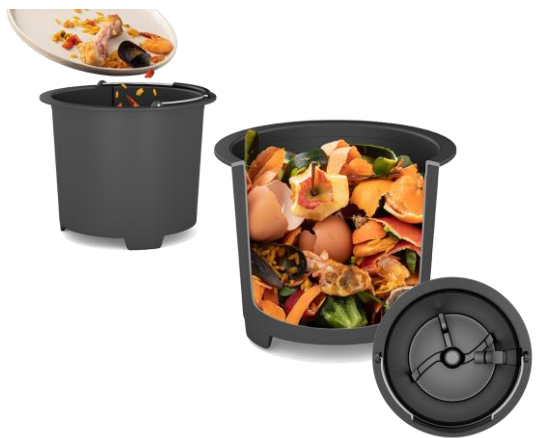
Cuve amovible de 3L (jusqu'à 600 g de déchets)