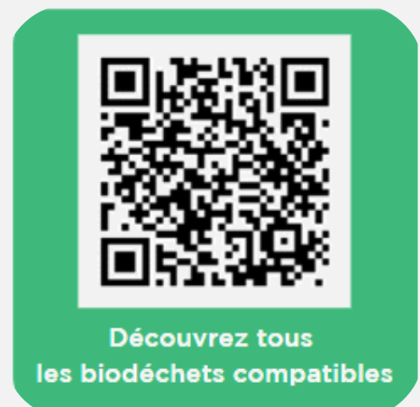
Découvrez tous les biodéchets compatibles