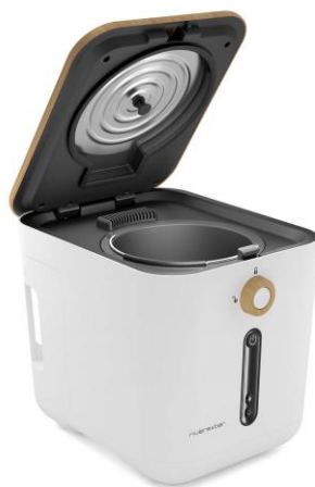
Design minimaliste, sans angles ni recoins pour un nettoyage facile